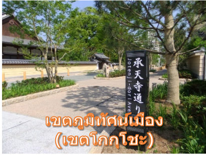
เขตภูมิทัศน์เมือง (เขตโคกโอะ)