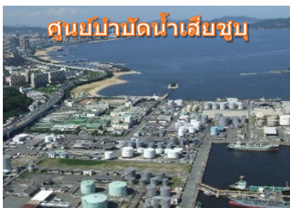
ศูนย์บำบัดน้ำเสียชุมชน