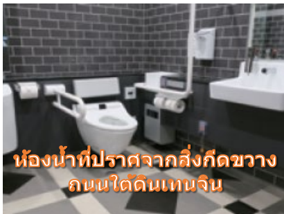
ห้องน้ำที่ปราศจากสิ่งกีดขวางกั้นแต่ดินเหนียว