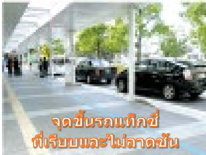
จุดขึ้นรถแท็กซี่ที่เรียบและไม่ลาดชัน