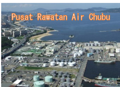
Pusat Rawatan Air Chubu

Untuk menggunakan sumber air dengan cekap, kami mempromosikan penggunaan air tebus guna dengan kumbahan yang dirawat. Di samping itu, kami mempromosikan penciptaan bandar penjimatan air dengan mengekalkan kadar kebocoran yang paling rendah di dunia dengan menjalankan tinjauan kebocoran sistematik dan mengemas kini paip air, dan dengan mengendalikan air secara cekap menggunakan sistem pelarasan pengagihan air. Tambahan pula, untuk menyampaikan air paip yang selamat dan lazat, kami telah menetapkan sasaran kualiti air kami sendiri yang lebih ketat daripada piawaian kebangsaan dan menjalankan pengurusan kualiti air yang menyeluruh.