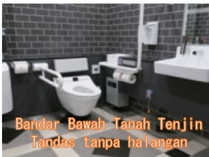
Bandar Bawah Tanah Tenjin Tandas tanpa halangan