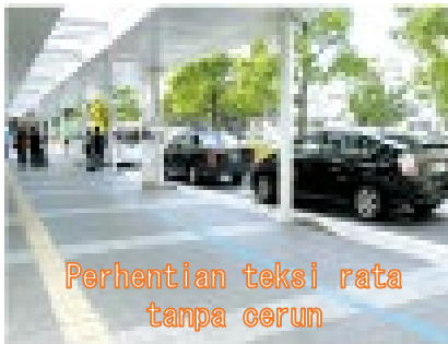
Perhentian teksi rata tanpa cerun

Apabila membina atau mengubah suai kemudahan penumpang yang digunakan oleh ramai orang, kami sentiasa berusaha untuk menjadikannya bebas halangan supaya ia selamat dan mudah digunakan untuk semua, dan kami akan mengusahakan perkakasan dan perisian bersepadu secara menyeluruh. Kami mempromosikan halangan- akses percuma. Memandang ke hadapan ke era kehidupan 100 tahun, kami mempromosikan projek "Fukuoka 100", yang merupakan projek industri-akademik-kerajaan-swasta semua-Fukuoka, yang bertujuan untuk mewujudkan masyarakat yang mampan di mana semua orang sihat dari segi mental dan fizikal boleh memainkan peranan aktif dengan cara mereka sendiri.