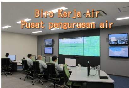
Biro Kerja Air Pusat pengurusan air