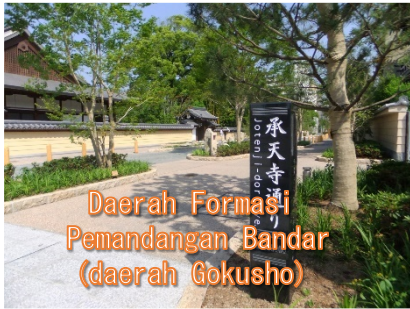
Daerah Formasi Pemandangan Bandar (daerah Gokusho)