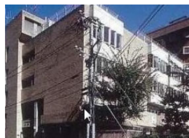
Trung tâm phúc lợi người già (Maizuruen)