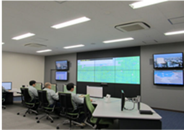
Trung tâm quản lý nước