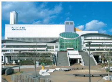
Nhà máy Rinkai