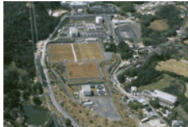
Nhà máy xử lý nước Meotoishi