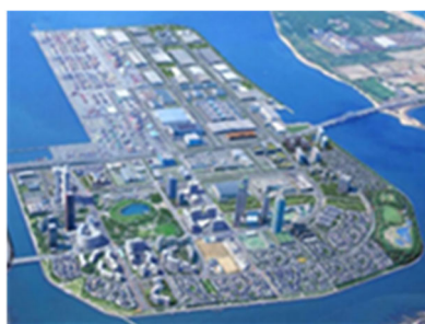
*Hình ảnh phối cảnh