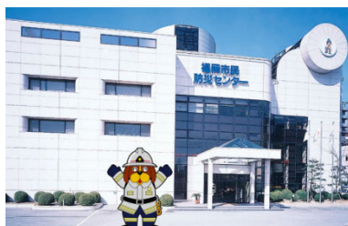
Trung tâm phòng chống thiên tai công dân Fukuoka