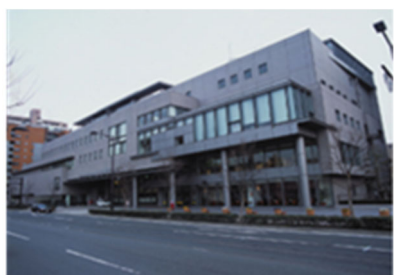
Trung tâm phúc lợi công dân thành phố Fukuoka