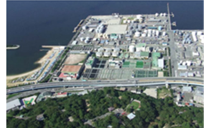
Trung tâm xử lý nước Chubu