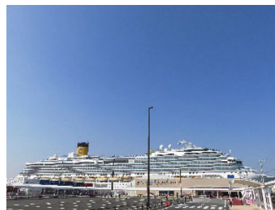
Trung tâm du thuyền Chuo Wharf