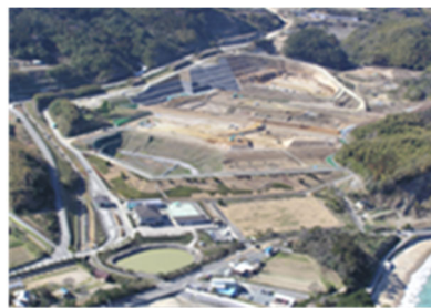
Điểm chôn lấp Seibu (Nakata)