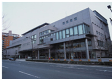
Plaza Kebajikan Warga Kota Fukuoka