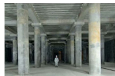
Kolam pengawalan air hujan Sanno No. 2