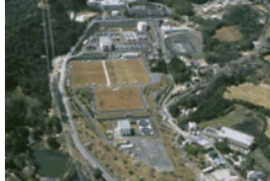
Loji Pembersihan Air Meotoishi