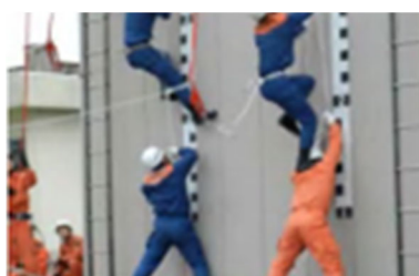
Akademi Pemadaman Kebakaran Bandar Fukuoka (Terhad untuk kakitangan pencegahan bencana)