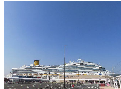
Pusat Pelayaran Dermaga Tengah