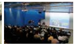
上海/アジア景観学会上海大会開催