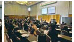
福岡/2013年アジア都市景観賞授賞式