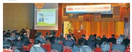
福岡/2014年アジア都市景観賞授賞式