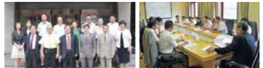
北京/2012年アジア都市景観賞最終審査会