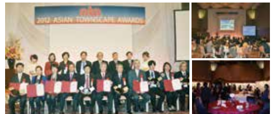
福岡/2012年アジア都市景観賞授賞式