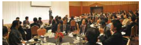
福岡/2011年アジア都市景観賞授賞式