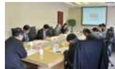
北京/アジア都市景観賞評価基準検討会