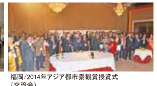
福岡/2014年アジア都市景観賞授賞式 (交流会)