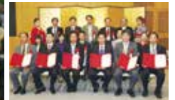
福岡/2010年アジア都市景観賞授賞式