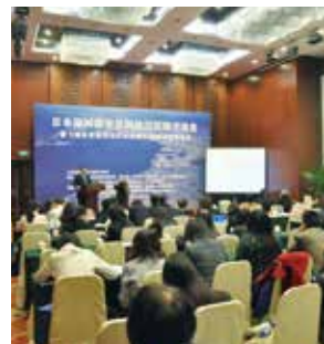
北京/シティプロモーション 「福岡市の景観形成によるまちづくり」