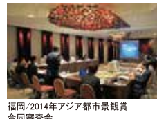
福岡/2014年アジア都市景観賞 合同審査会