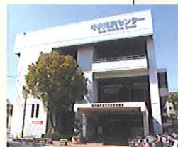
◆福岡市立中央市民センター