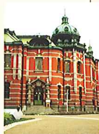
◆福岡市赤煉瓦文学館

◆参加費【通し料金】◆ 一般/3,000円 学生/2,000円 (※一会場1,000円)