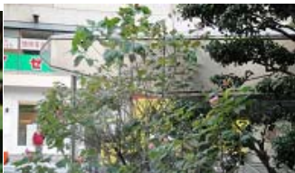
←市役所西側広場の植え込み 芙蓉の花のマンホールの蓋→ (さすがは福岡市の花！)