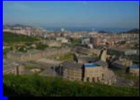
中国大連ソフトウェアパーク (2009年受賞)