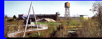
ドイツ・ボシュムの旧クルツボ製鉄所跡地を活用した芸術文化のまち創出(2008年受賞)